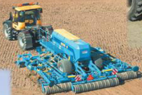
radličkové secí stroje Excelent