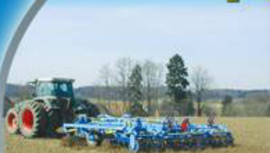
radličkové kypriče Hurikán