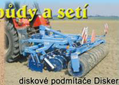
diskové podmiťáče Disker