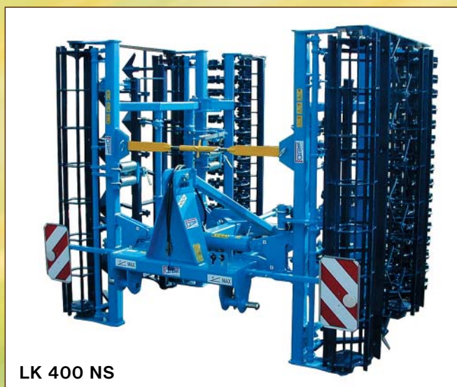
LK 400 NS